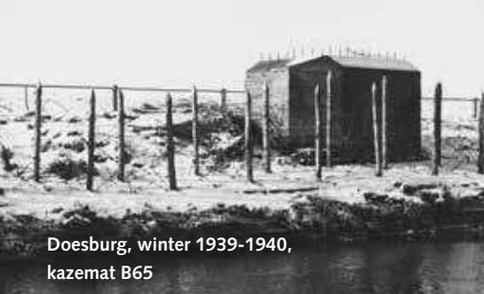
Doesburg, winter 1939-1940, kazemat B65