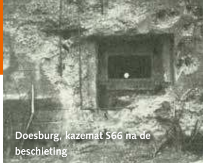
Doesburg, kazemat S66 na de beschieting