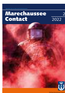
Foto omslag: 2022, Harskamp, training Bijstandseenheid (BE)