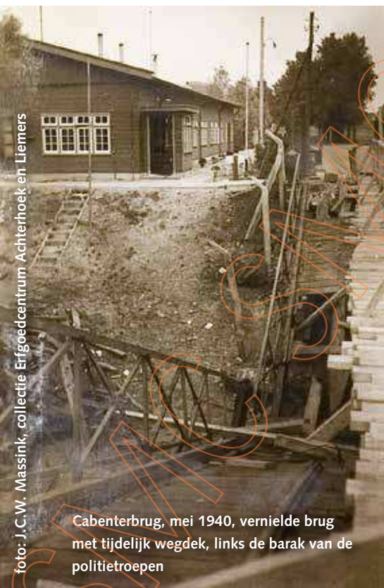
Cabenterbrug, mei 1940, vernielde brug met tijdelijk wegdek, links de barak van de politietroepen

Wilt u reageren? Uw reactie is welkom op het redactieadres of rechtstreeks per e-mail aan de auteur op marechaussee4045@gmail.com.